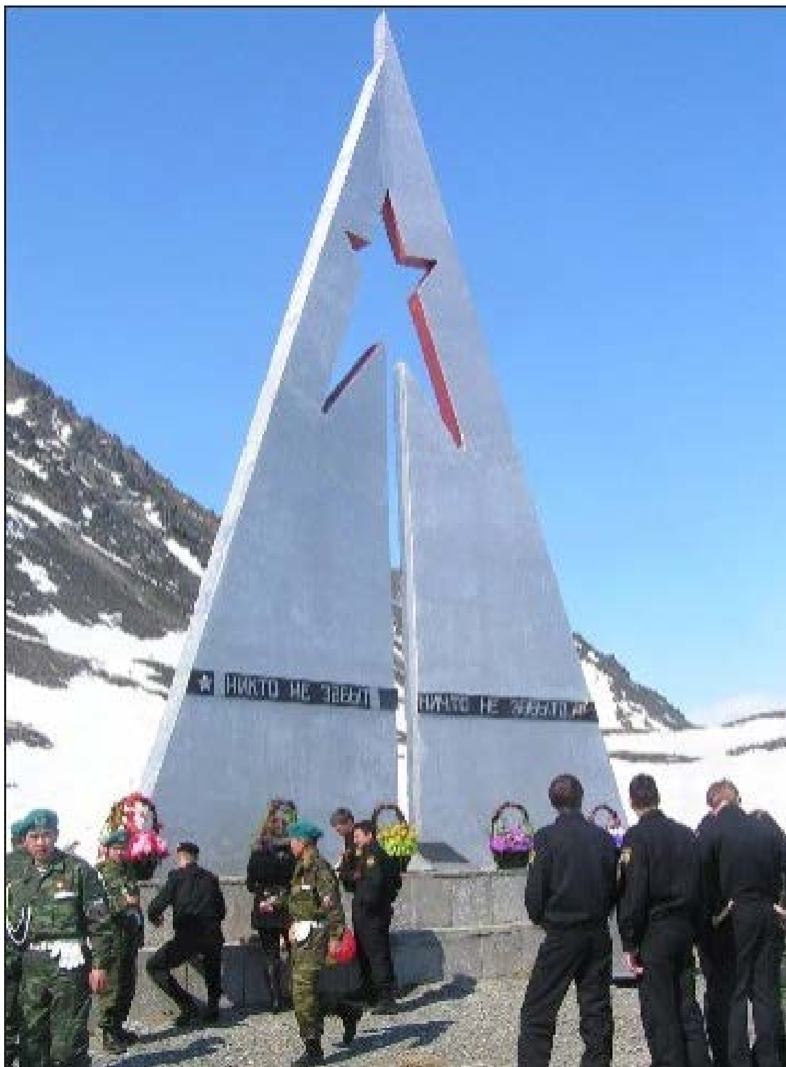
Мероприятия, проводимые возле монумента.