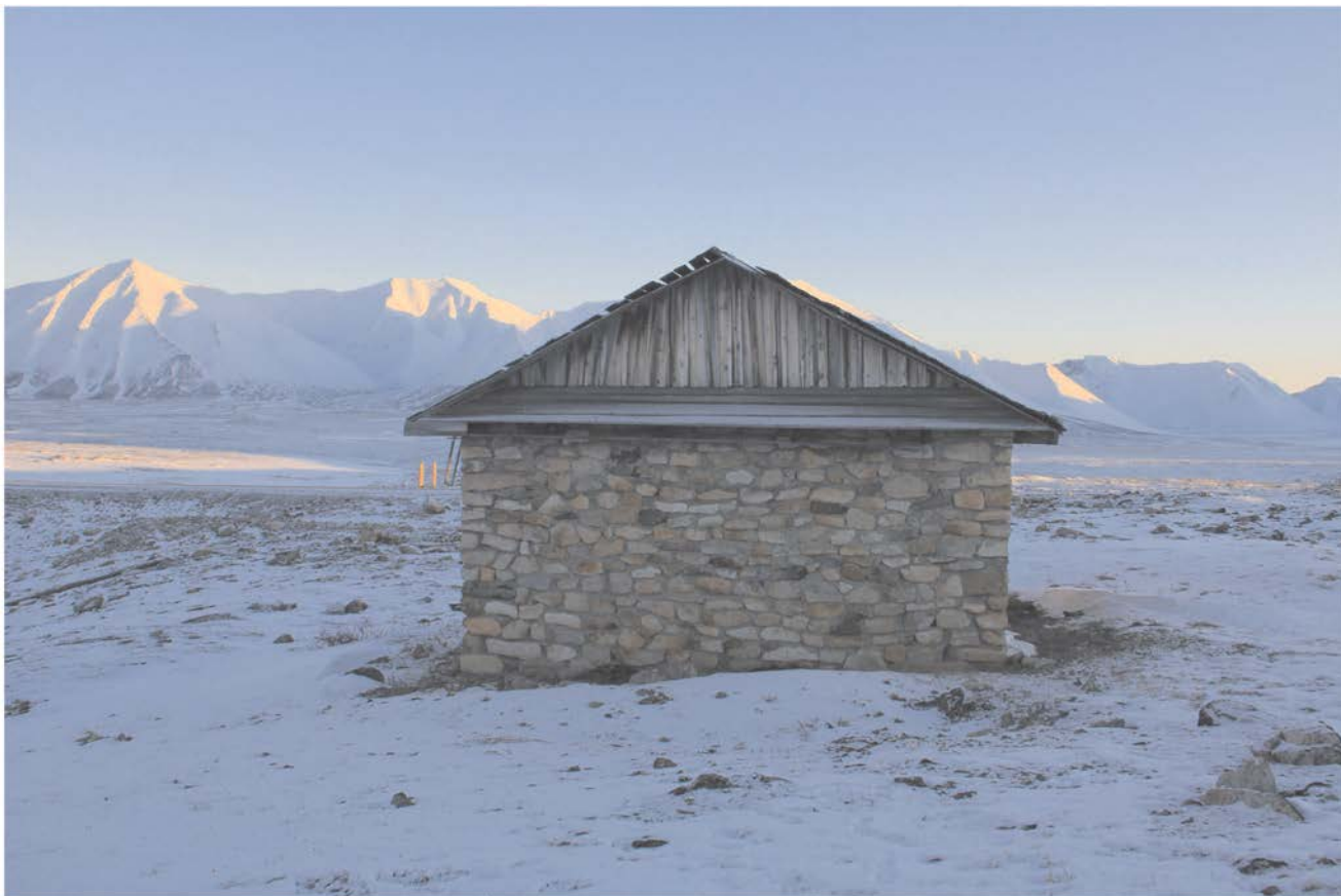
Строение № 3.