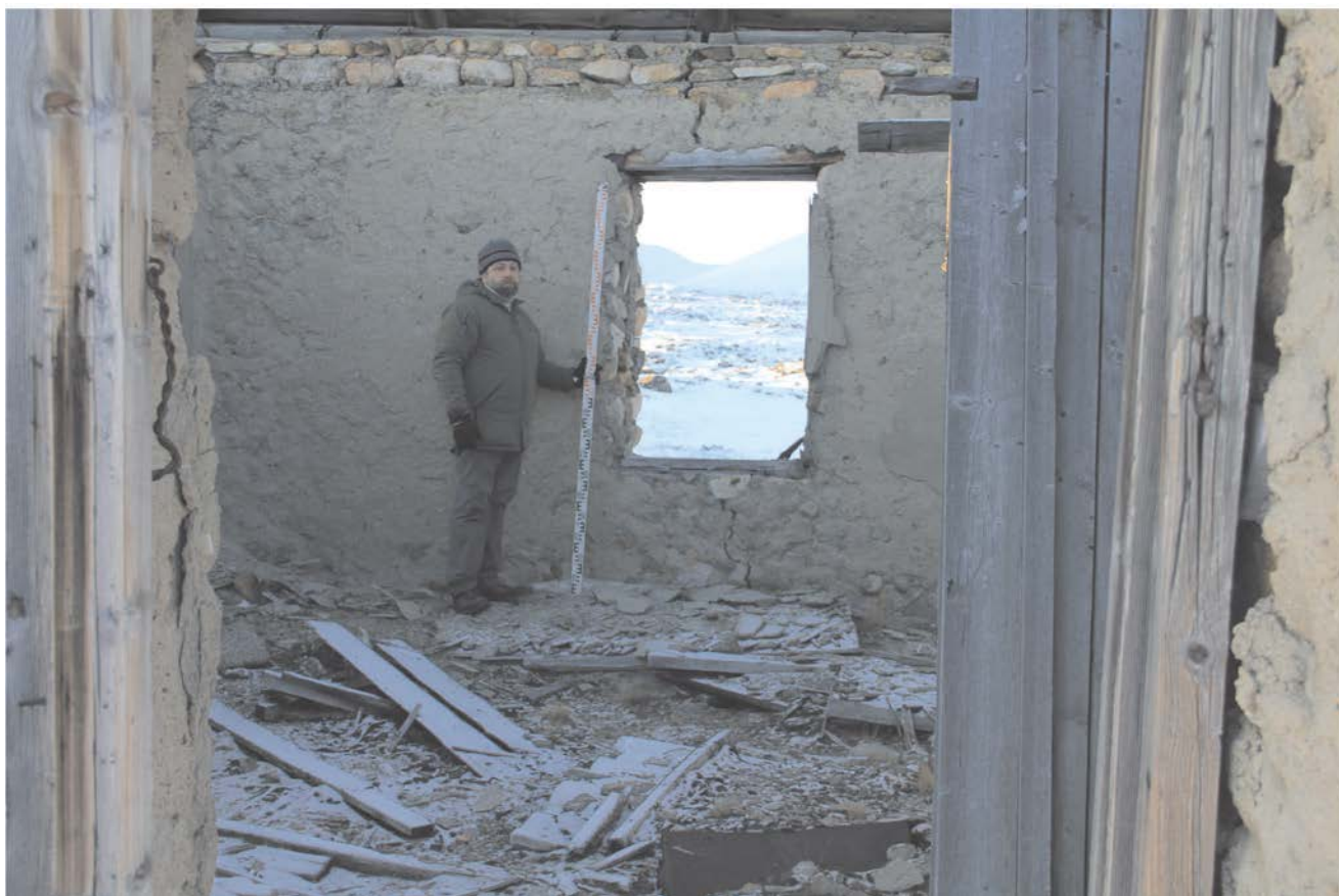
Строение № 2. Внутренние помещения.