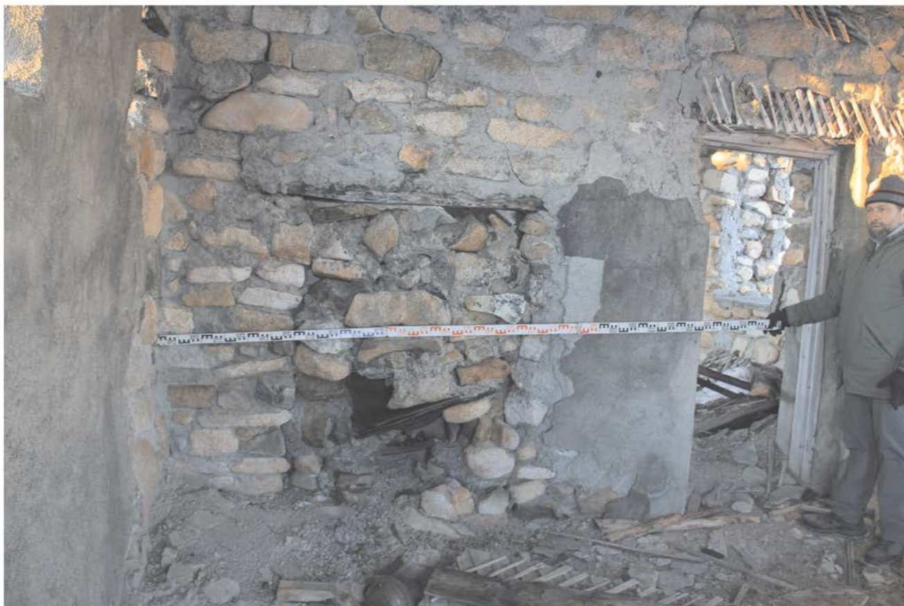
Строение № 3. Внутреннее помещение.