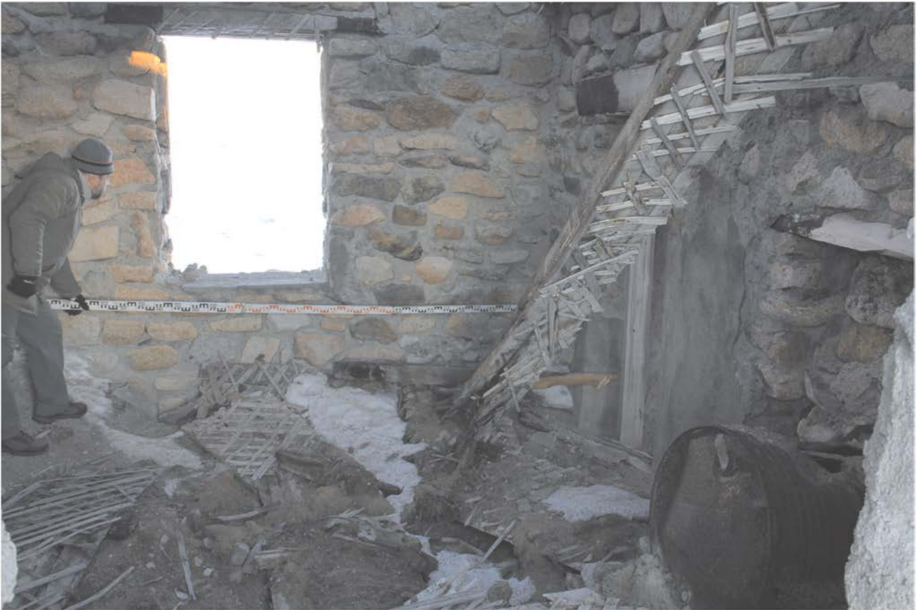
Строение № 3. Внутреннее помещение.