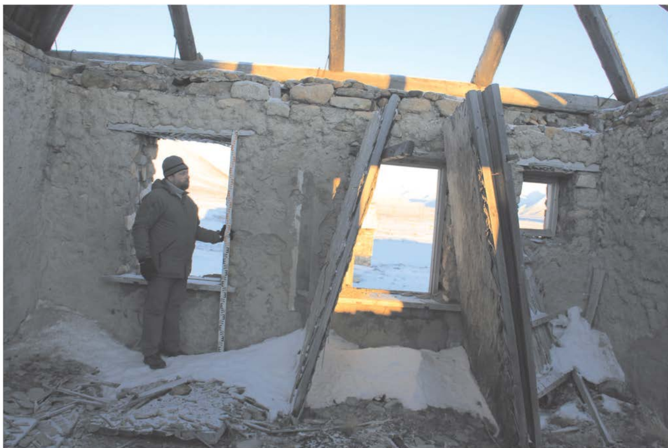
Строение № 2. Внутренние помещения.