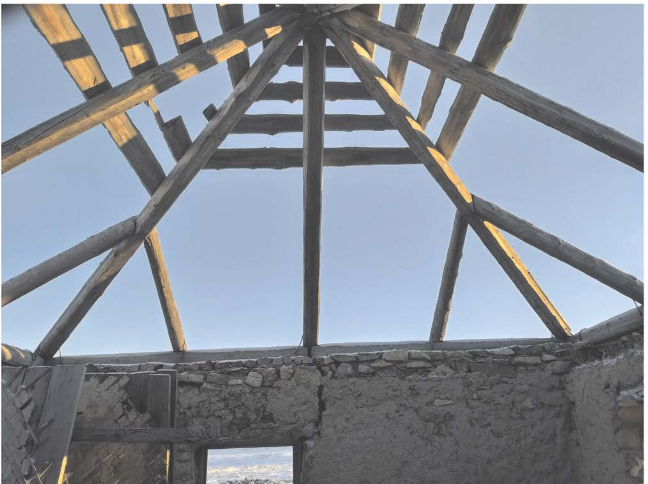
Строение № 2. Стропильная система.