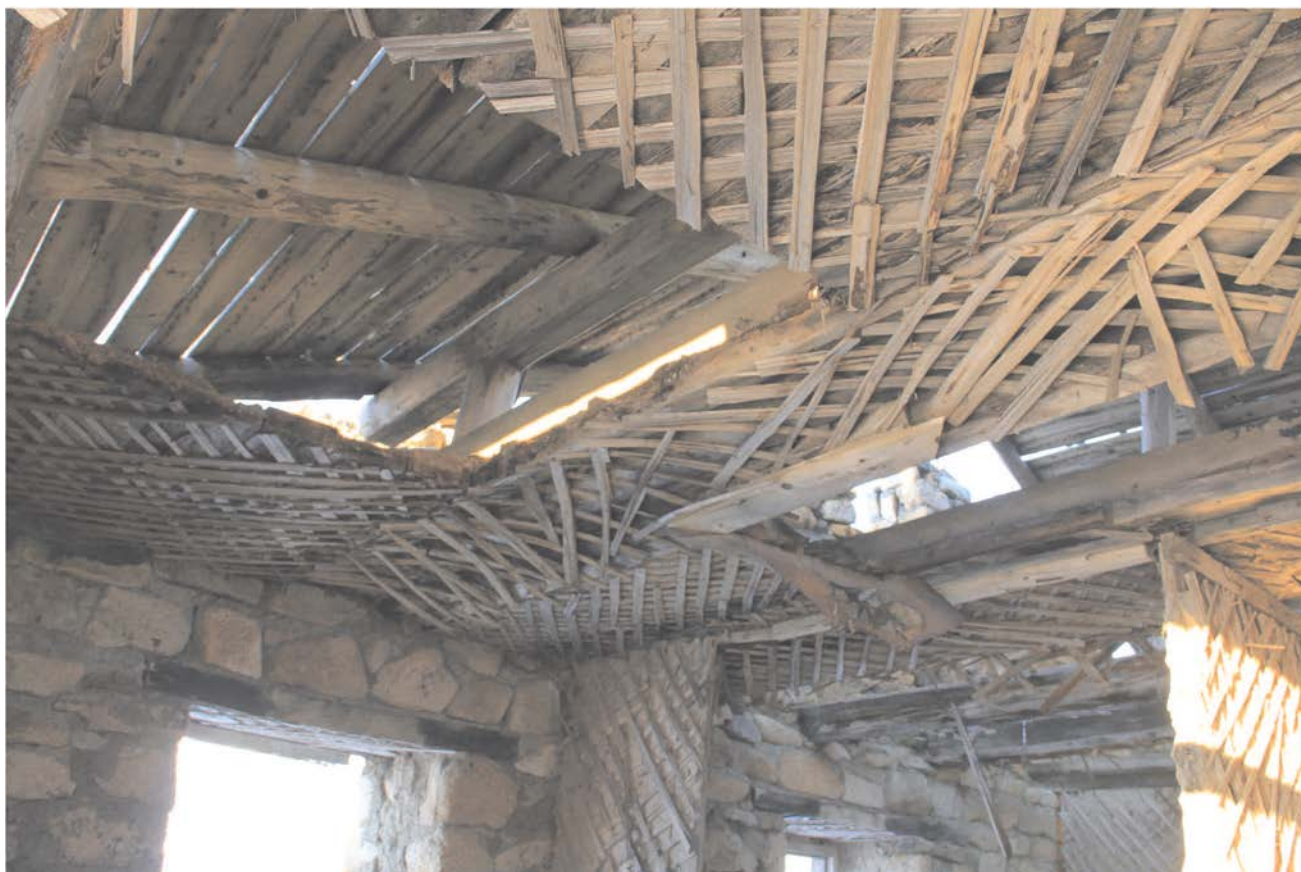
Строение № 1. Вид крыши из помещения.