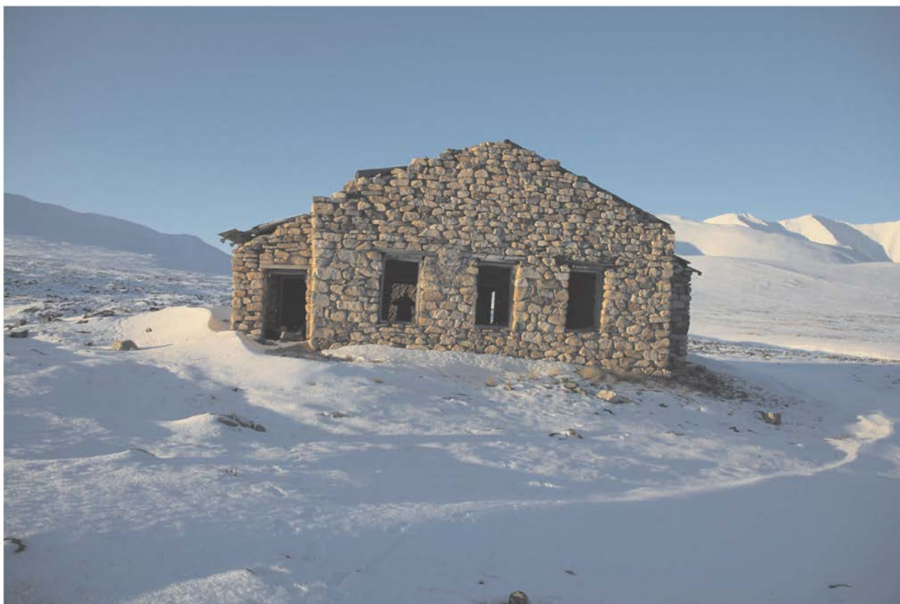
Строение № 1. Юго-восточный фасад.