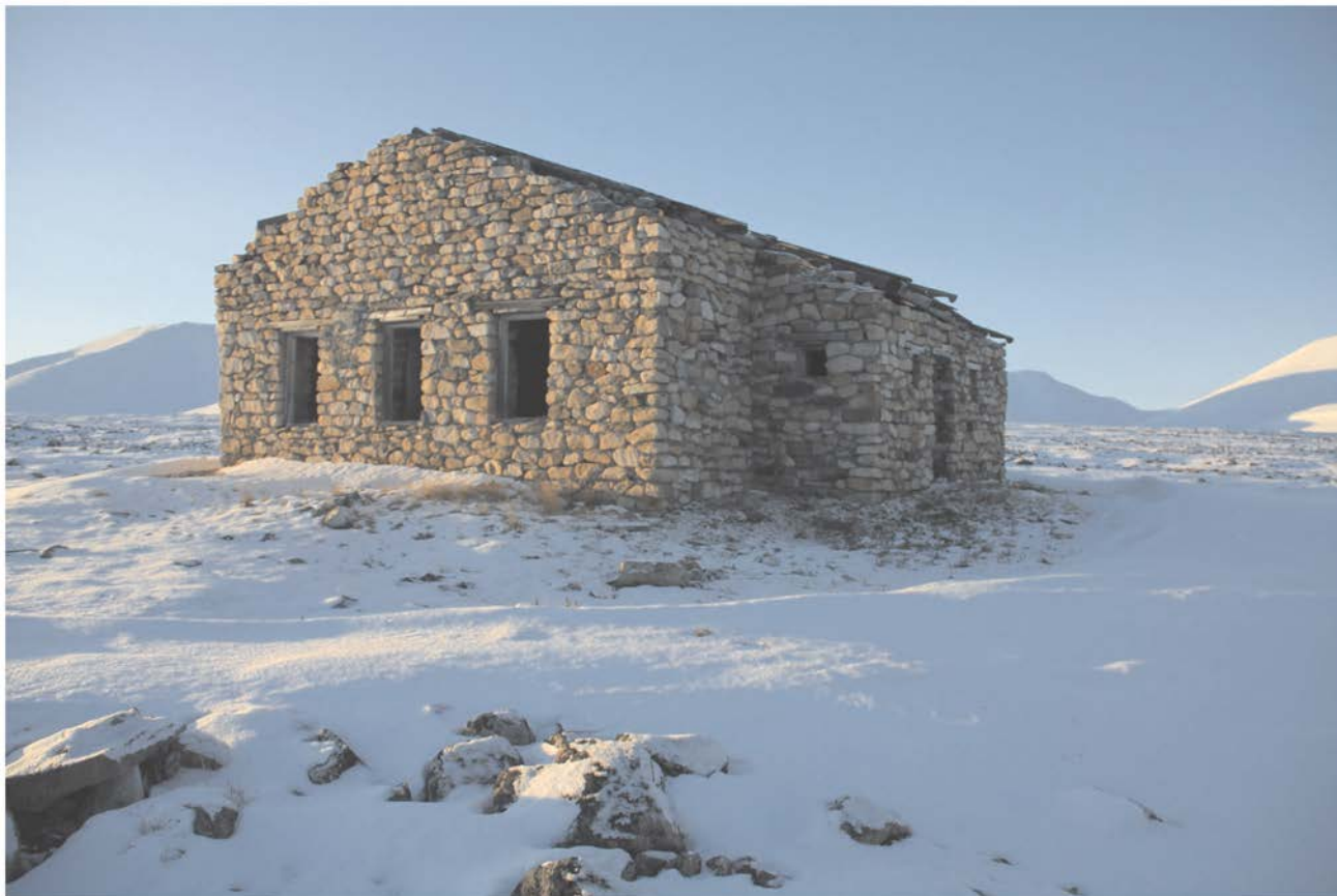
Общий вид строения № 1.