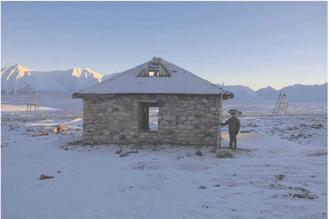
Строение № 2.