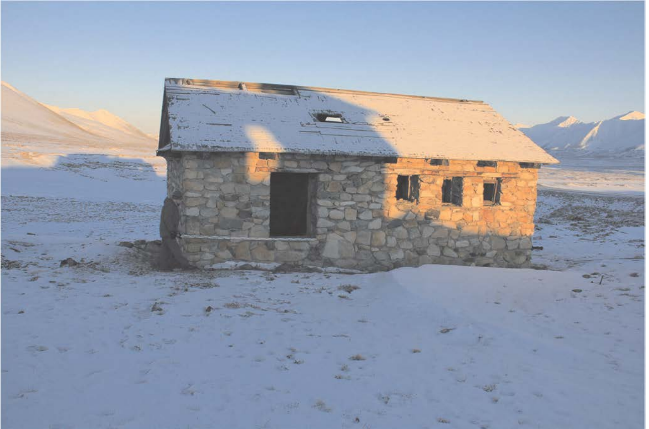
Строение № 3.