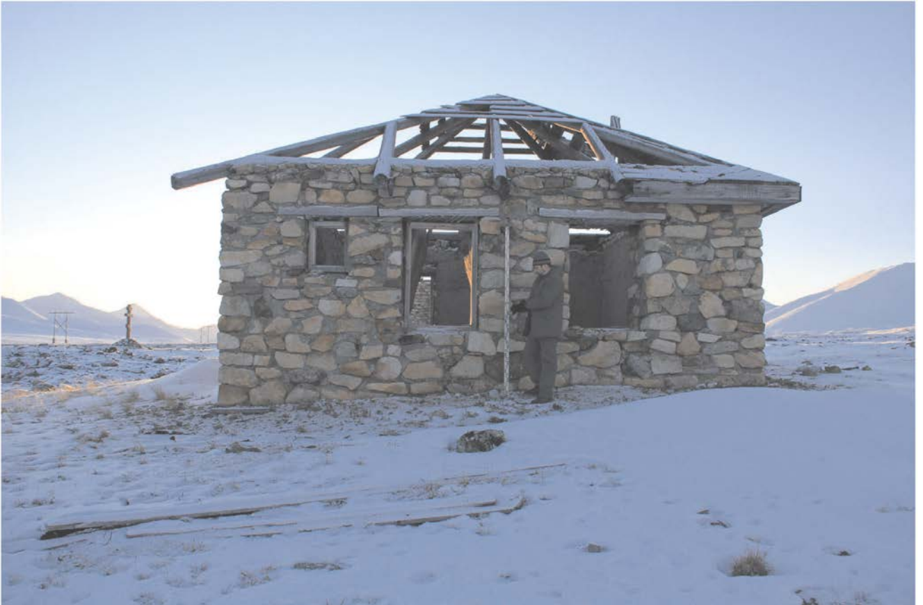
Строение № 2.