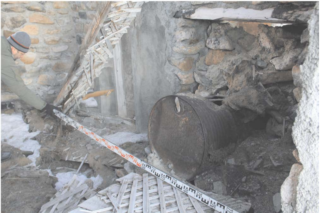
Строение № 3. Внутреннее помещение.