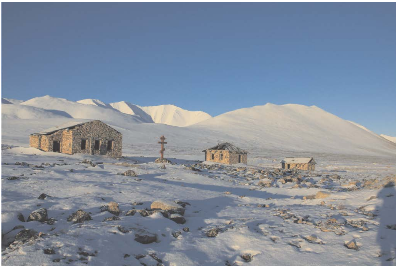
Вид Объекта с юго-востока.