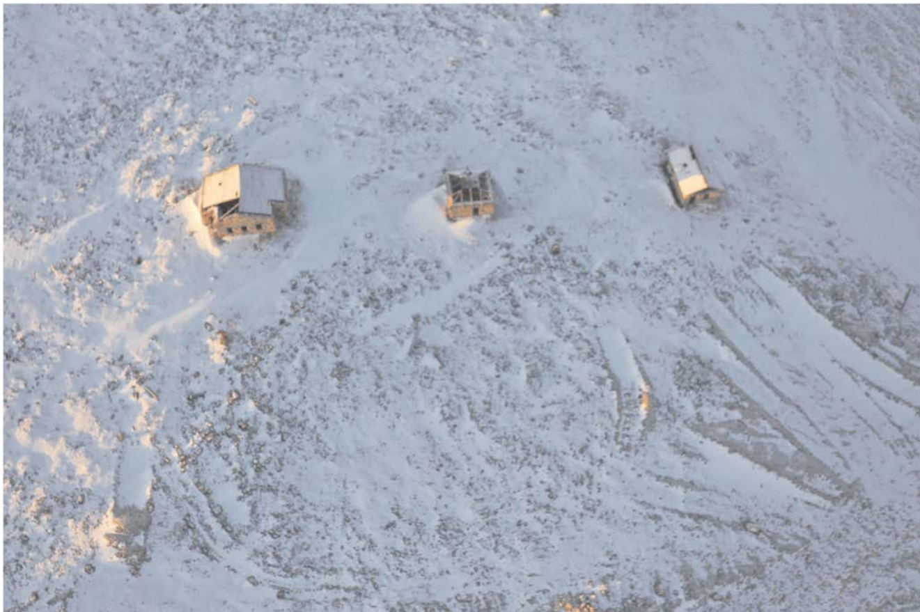
Вид Объекта сверху.