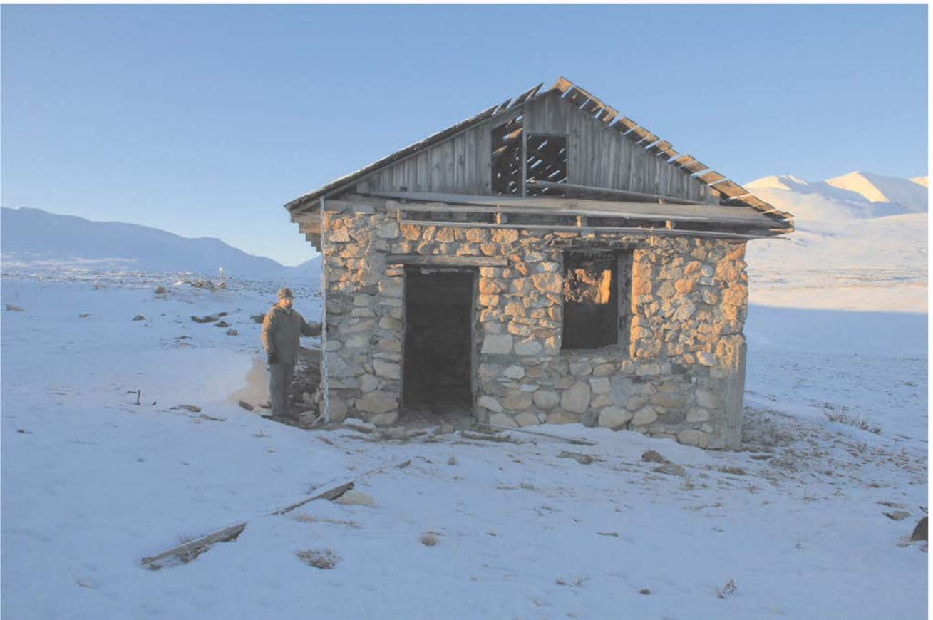
Строение № 3.