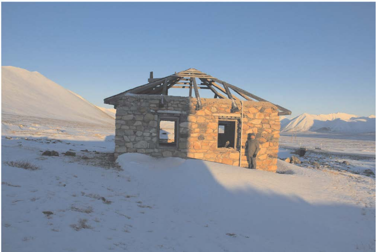
Строение № 2.