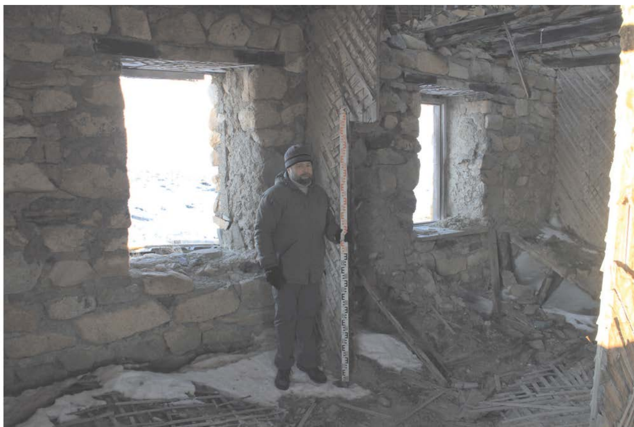
Строение № 1. Внутренний вид.