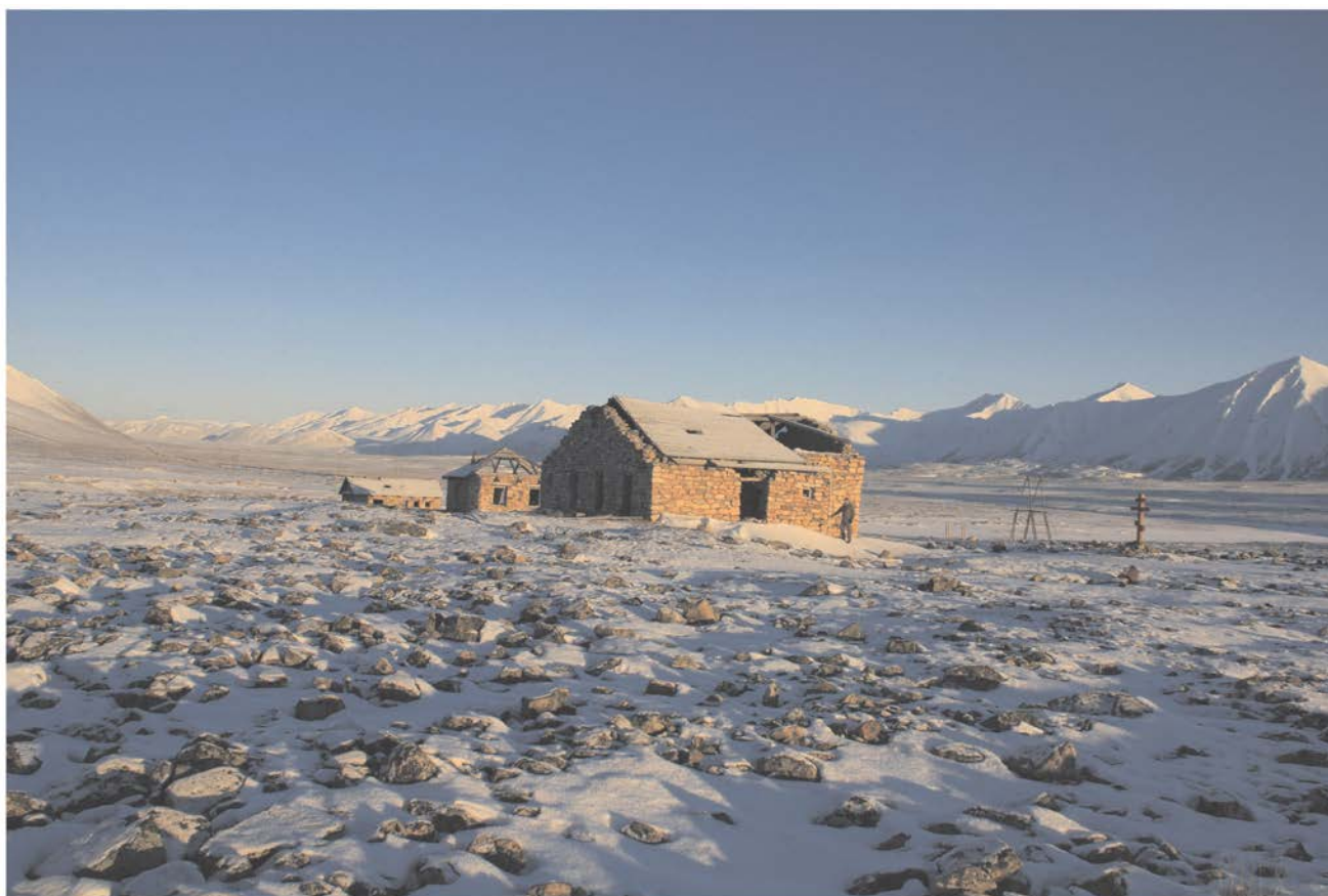
Вид Объекта с юго-запада.