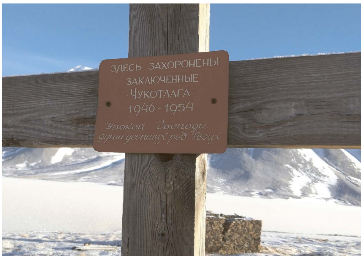
Табличка на кресте.