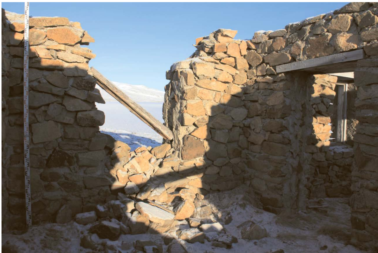
Внутренний вид строения.