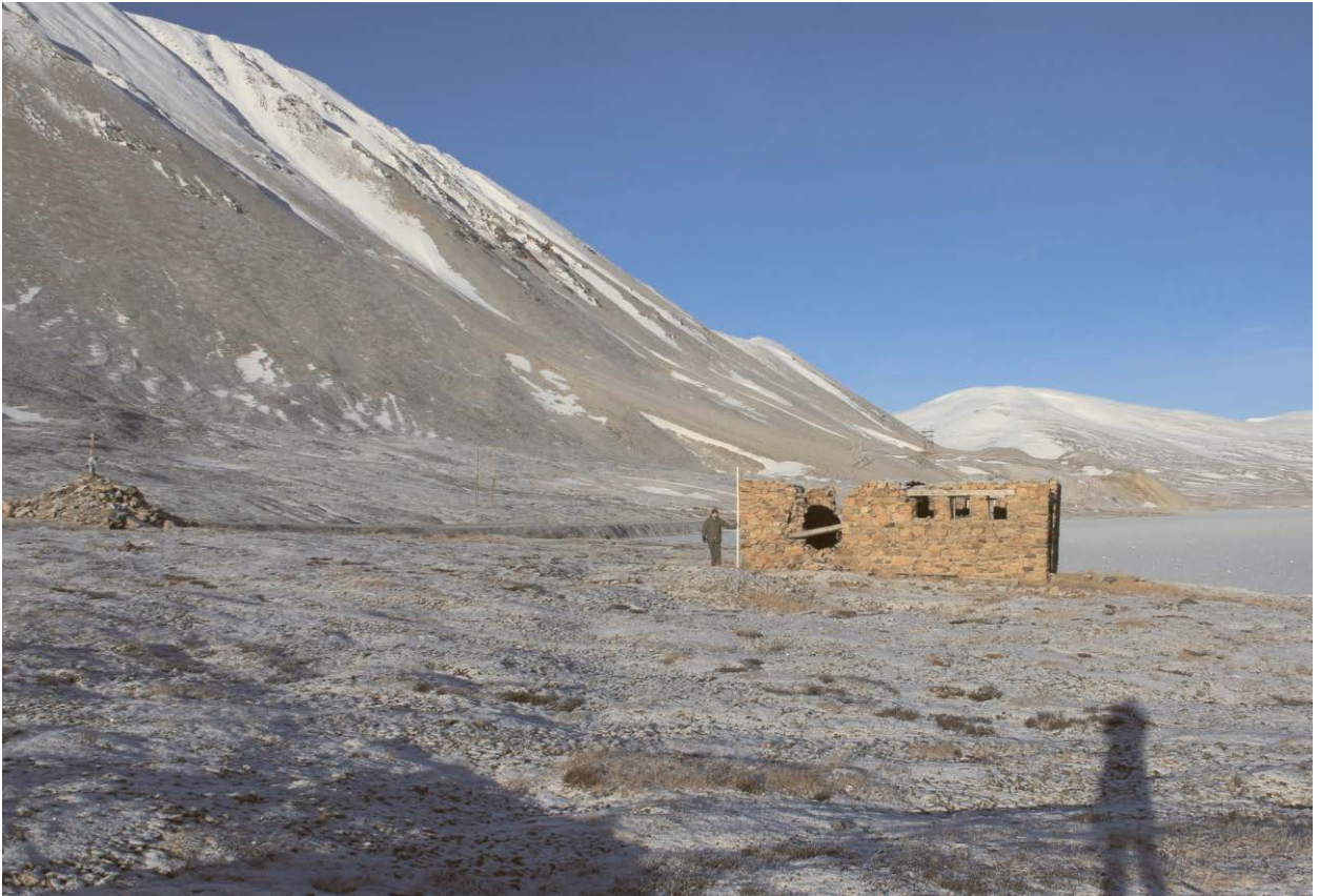
Вид Объкта с юго-востока.