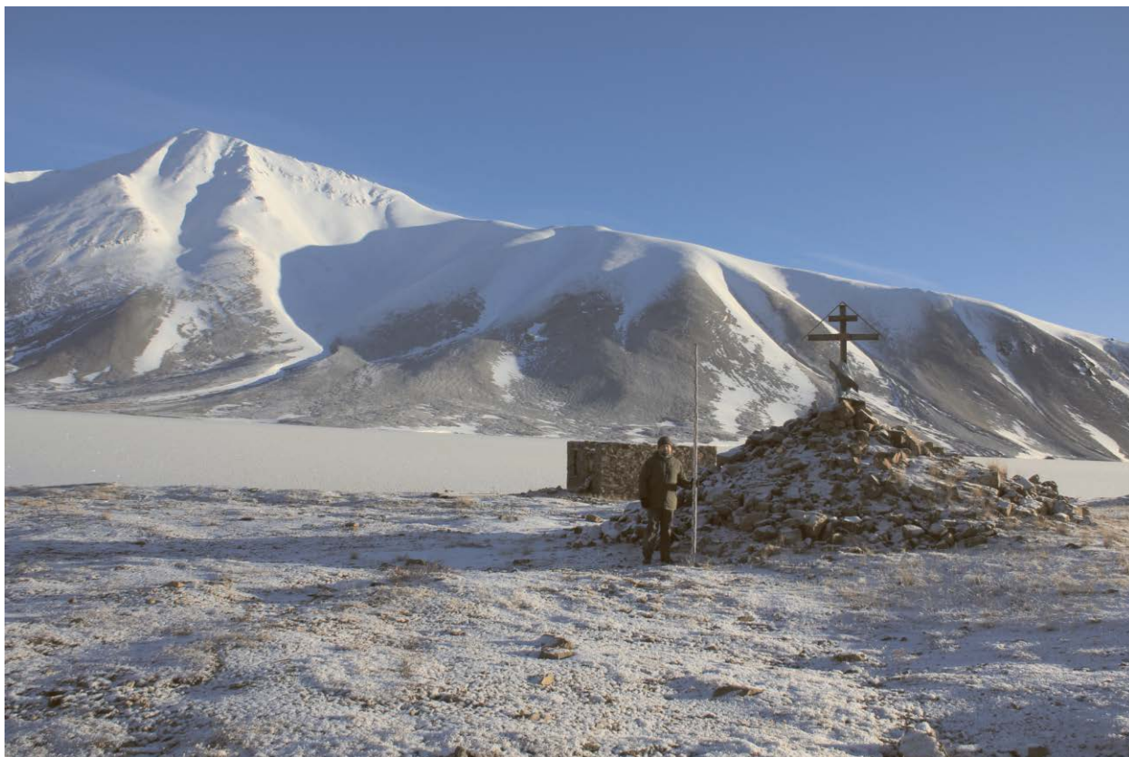
Могильный холм из природного камня с крестом на вершине.