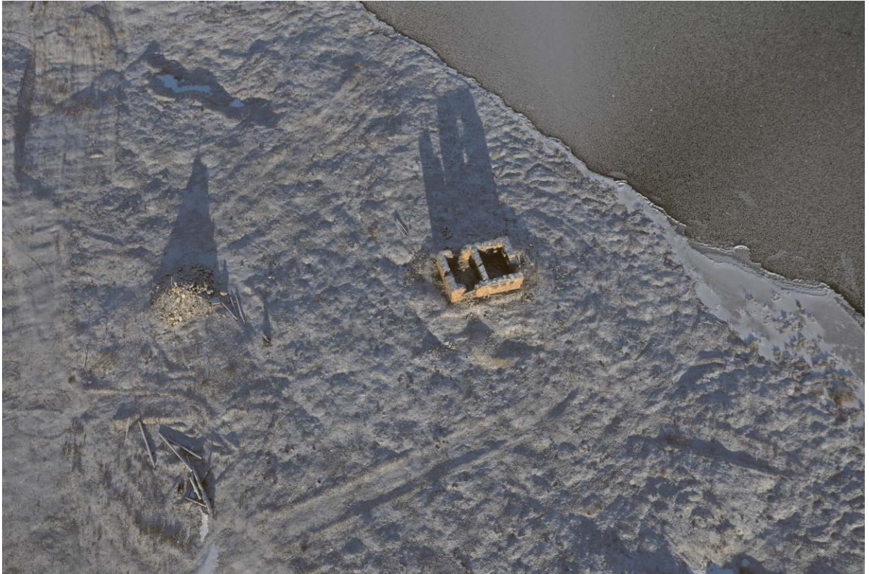
Вид Объекта сверху.