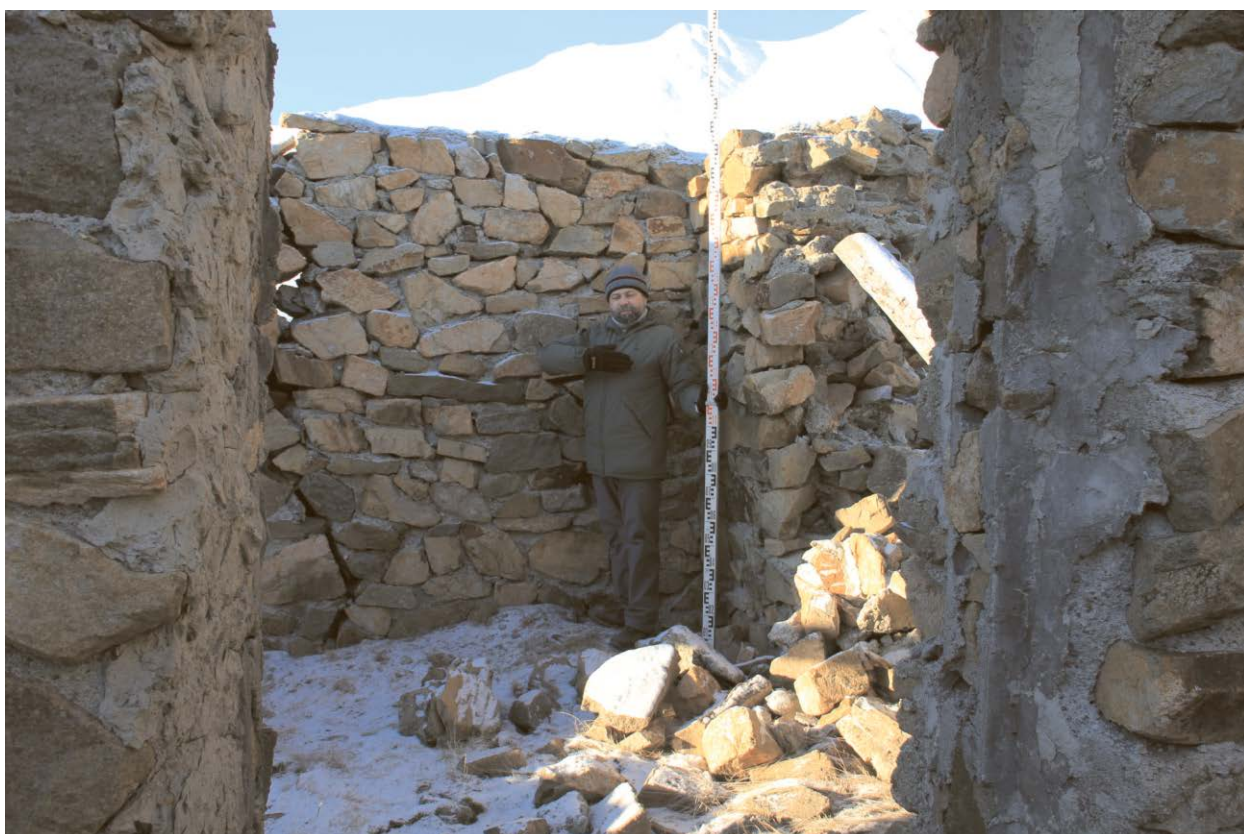
Внутренний вид строения.