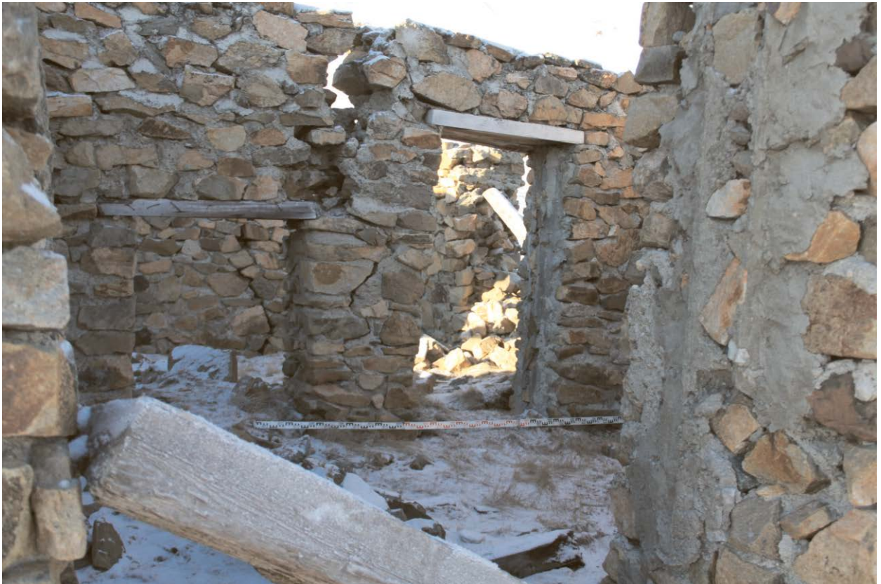
Внутренний вид строения.