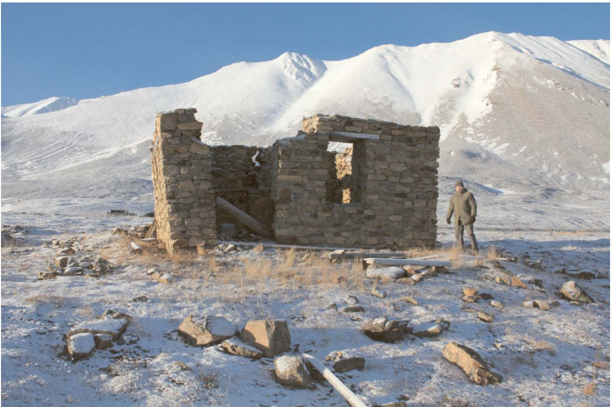
Вид строения с востока.