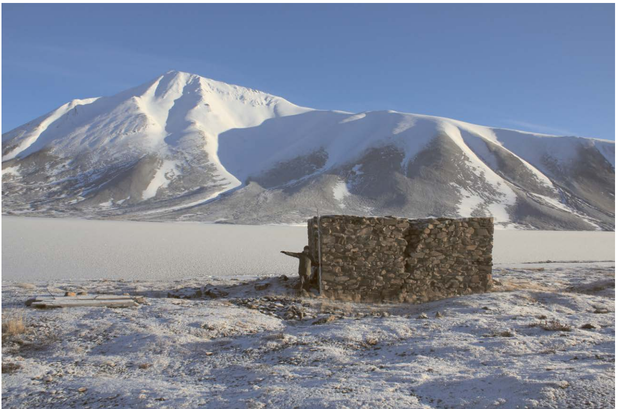
Вид строения с запада.