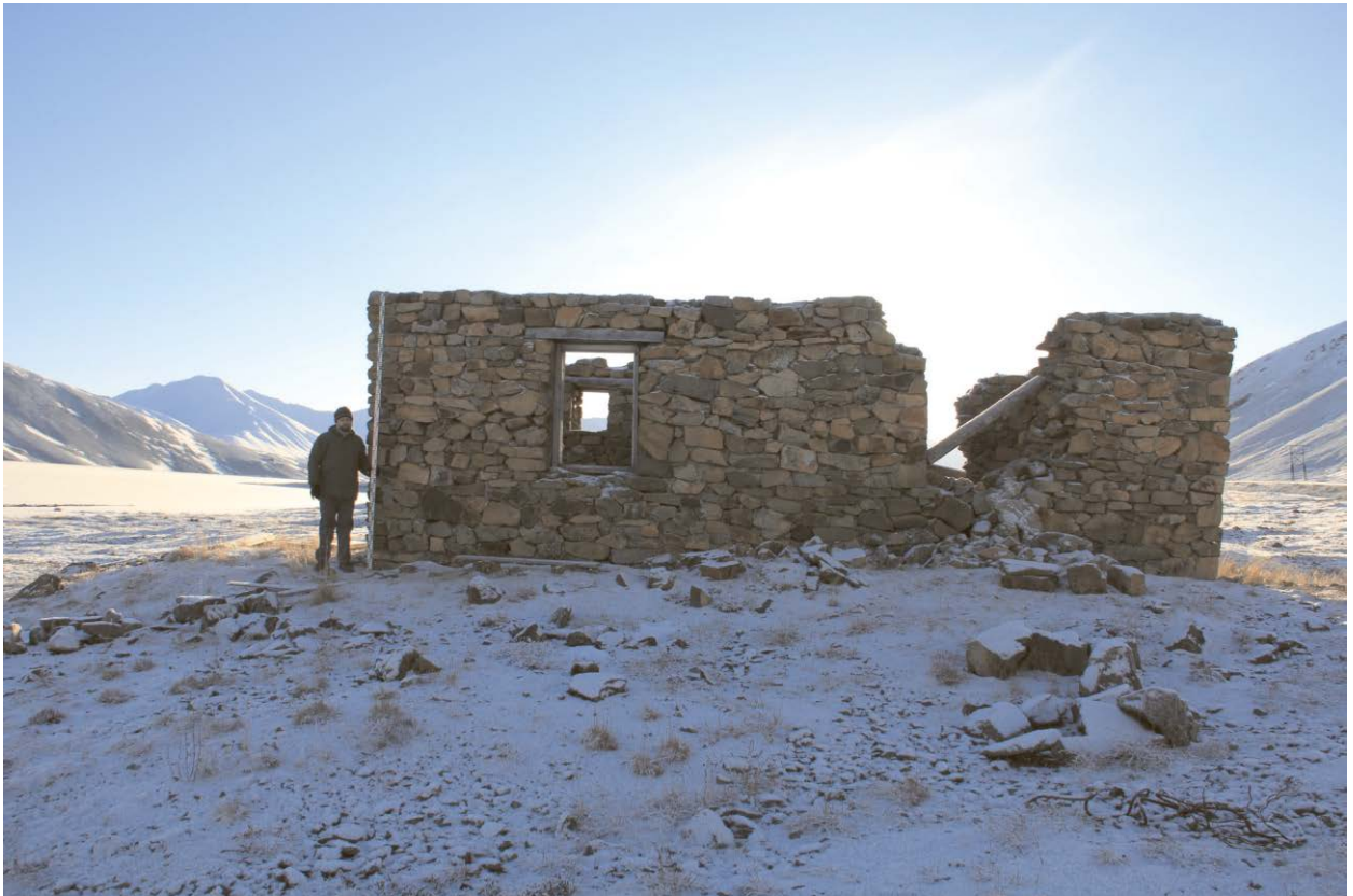
Общий вид строения.