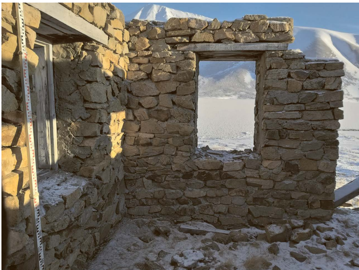
Внутренний вид строения.