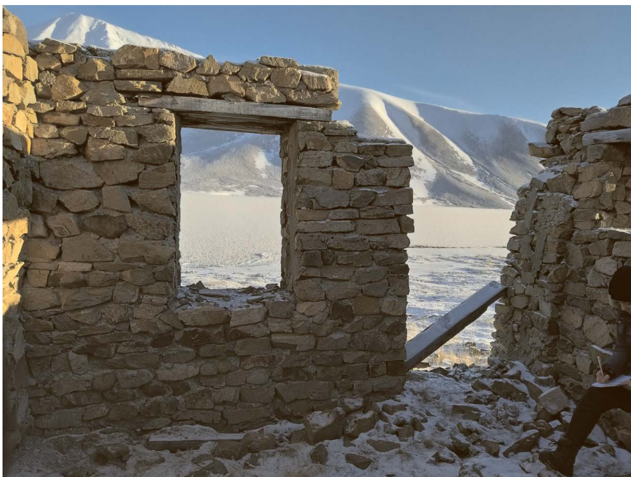
Внутренний вид строения.