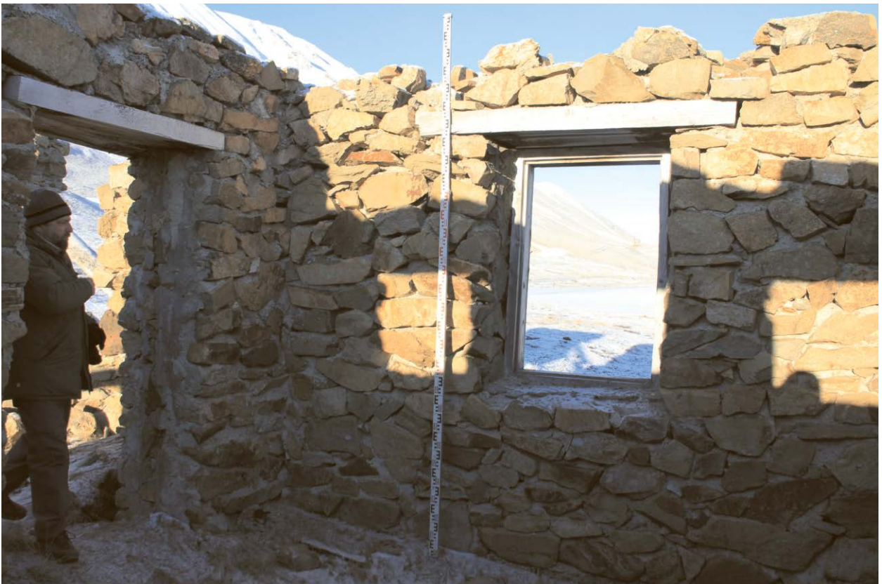
Внутренний вид строения.