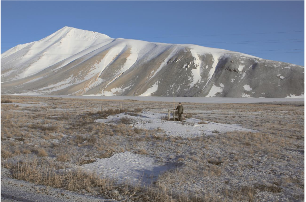
Строение № 16, общий вид