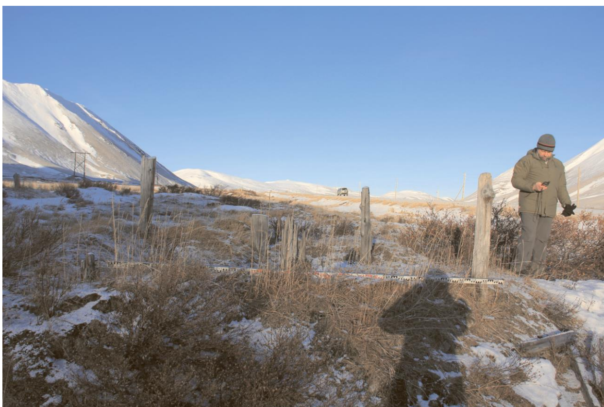
Строение № 4, общий вид