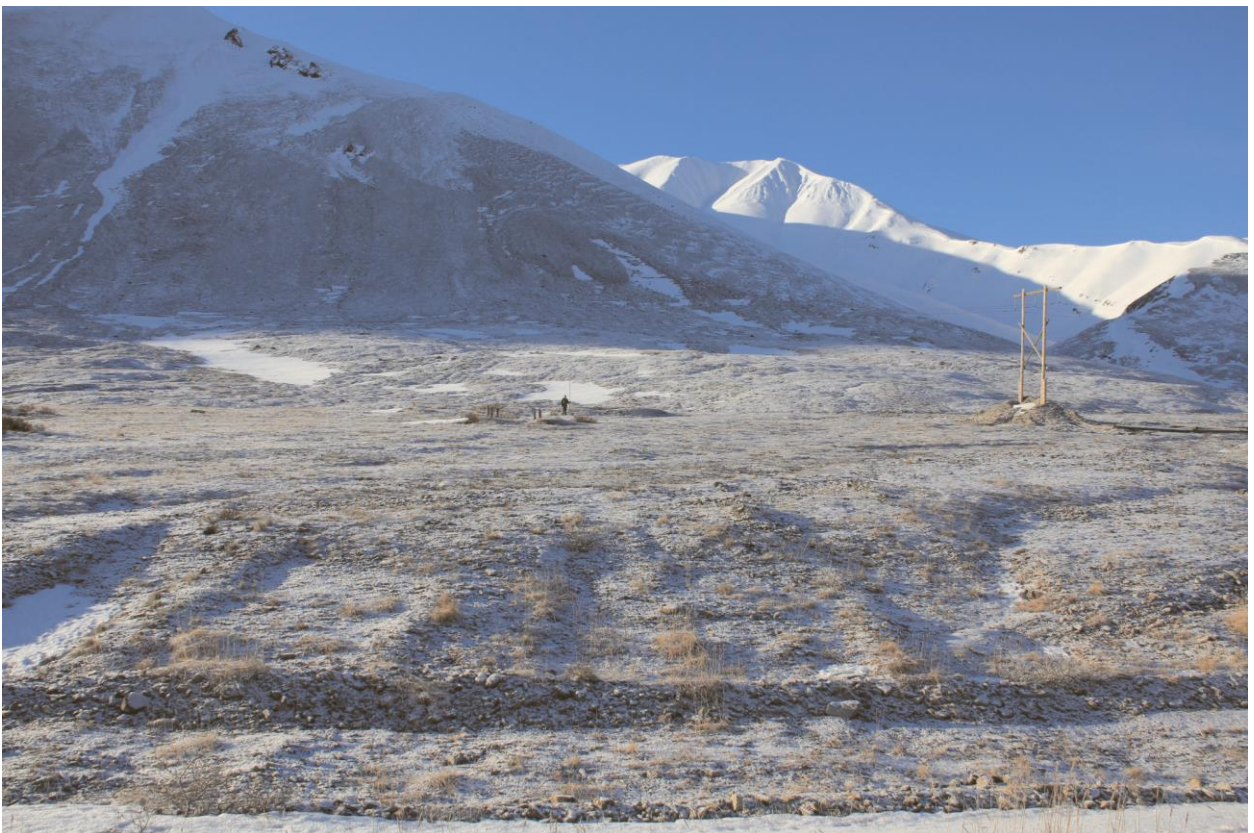
Строение № 11, общий вид