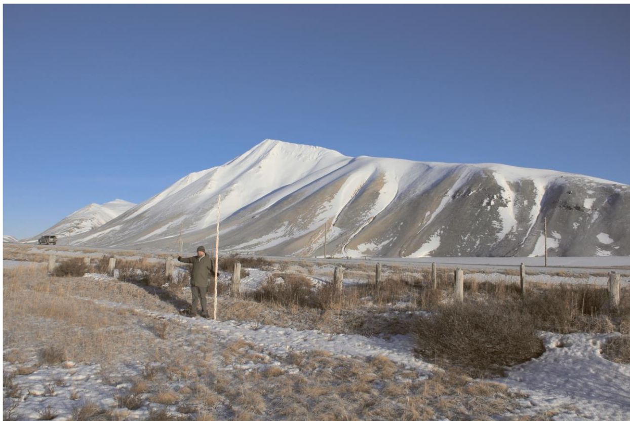
Строение № 6, общий вид