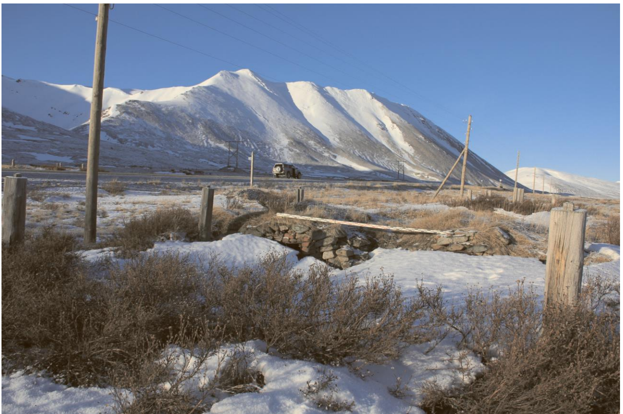
Строение № 15, общий вид с востока