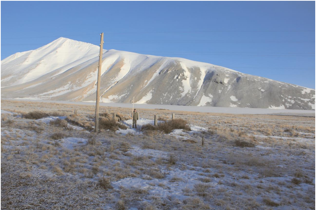
Строение № 15, общий вид с запада