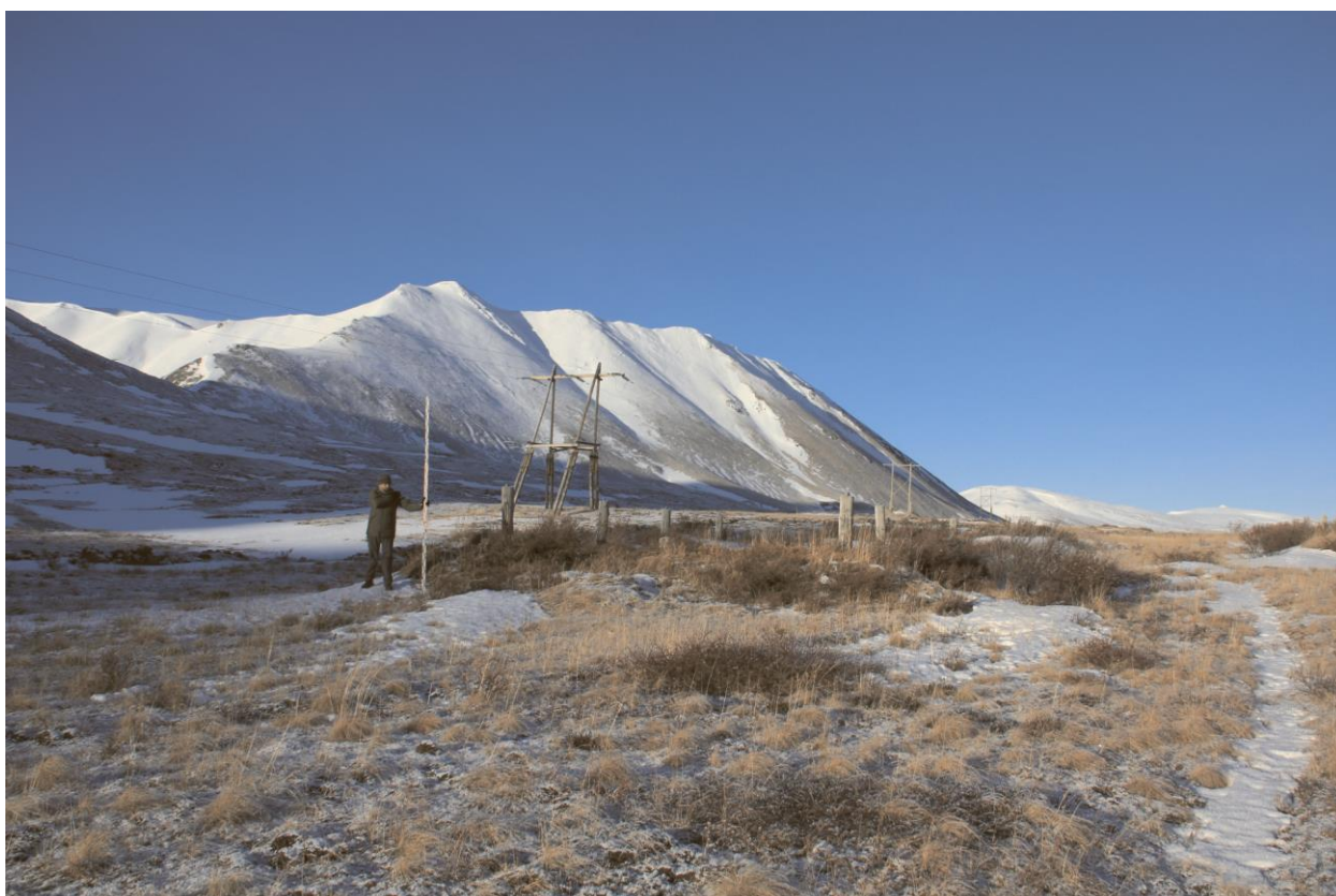
Строение № 6, общий вид