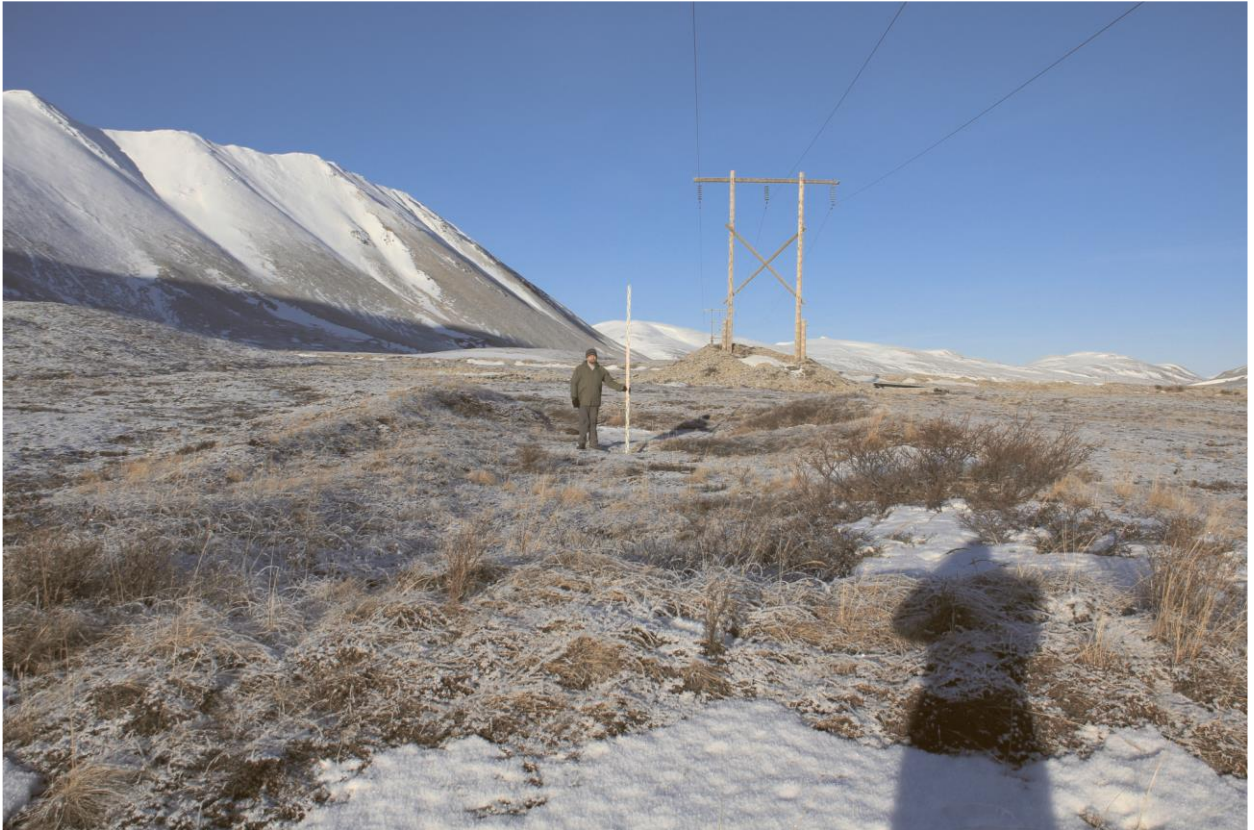
Строение № 10, общий вид