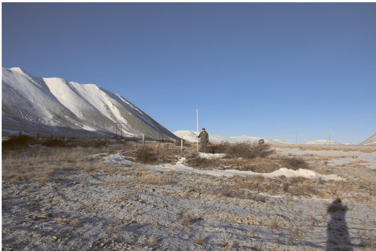
Строение № 4, общий вид