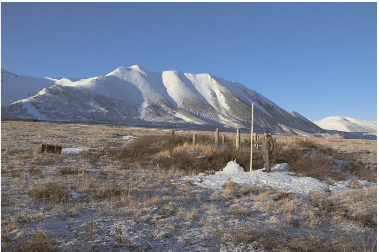
Строение № 17, общий вид с востока