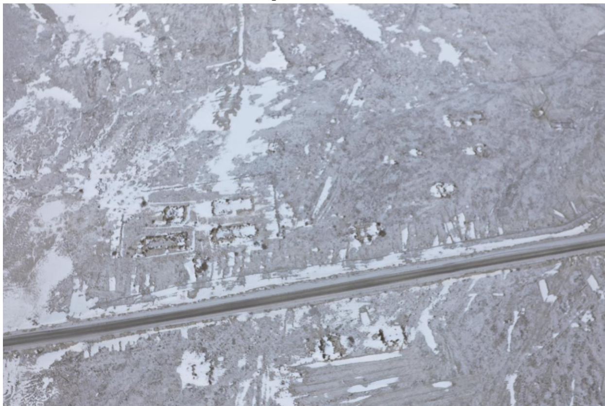
Вид Объекта сверху.