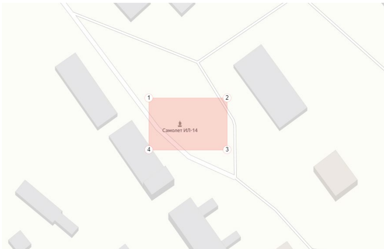
Схема границы территории выявленного объекта культурного наследия «Памятник «Ил-14»»

Памятник расположен на земельном участке с кадастровым номером 87:03:040003:4, площадью 199200 кв.м. Площадь в границах территории выявленного объекта культурного наследия 996 кв. м. Адрес участка по данным НСПД: Чукотский автономный округ, Иультинский район, пгт. Мыс Шмидта. Категория земель: земли населённых пунктов. Вид разрешенного использования: под производственные нужды.