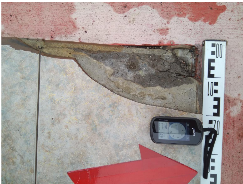
Рис. 3. Чукотский автономный округ. Город Анадырь. Памятник регионального значения «Памятник В.И. Ленину». Дефект основания в виде скола на всю глубину плиты (облицовочная плитка и бетонное основание) в северо-западном углу постамента.